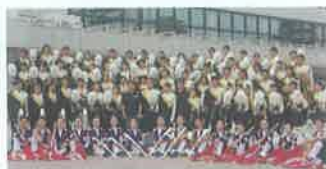
大牟田高校吹奏楽部