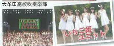
スプラウトダンススタジオ