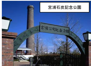
宮浦石炭記念公園

宮浦坑跡を公園化。明治時代の煙突が残り、石炭化学から発祥した工業地帯が一望できる。