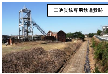
三池炭鉱専用鉄道敷跡

宮原坑や万田坑などの各坑口と三池港をつないだ鉄道敷跡。レールは撤去されているが枕木が残る。宮原坑と一緒に見学できる。